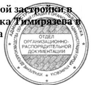
СХЕМА границ комплексного развития территории жилой застройки в границах улиц Фурманова, Олега Кошевого, 3 переулка Тимирязева в Ленинском районе города Ульяновска (кадастровый квартал 73:24:040801)

«ПРИЛОЖЕНИЕ 1 к постановлению администрации города Ульяновска от 20.06.2024 № 643