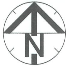
Схема планировочной организации земельного участка 1:500