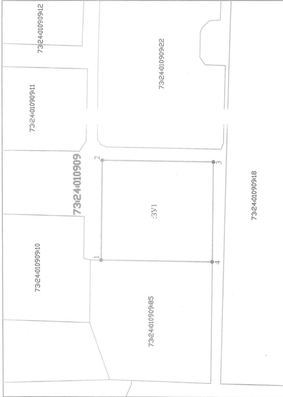
СХЕМА РАСПОЛОЖЕНИЯ ЗЕМЕЛЬНЫХ УЧАСТКОВ НА КАДАСТРОВом ПЛАНЕ ТЕРРИТОРИИ